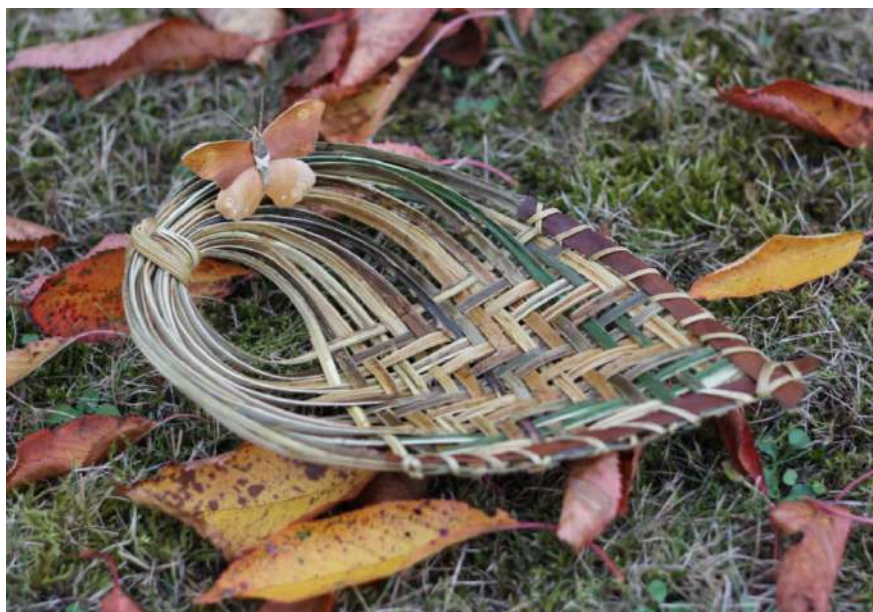
Modèle d'inspiration pour l'atelier

Escapade nature à la mi-journée : un moment d'observation des alentours avec un autre regard si le temps le permet.